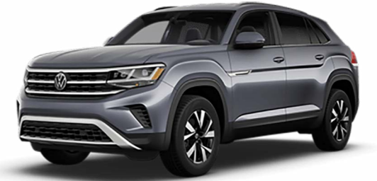
Xám Platinum Metallic