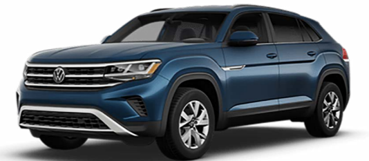
Xanh Tourmaline Metallic